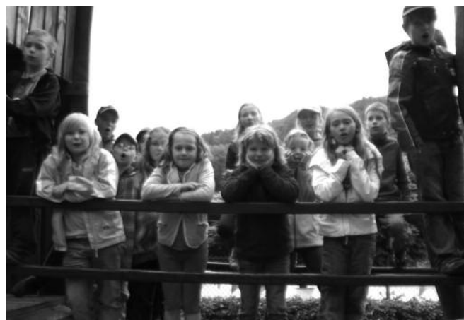
Hortkinder in Einsiedel“

Diese drei Veranstaltungen waren ein voller Erfolg. Und die Kinder haben somit die Erfahrung gemacht, was dazu gehört so etwas zu planen und durchzuführen. Jedenfalls können sie jetzt mit wenig Kosten ihren Abschluss in Einsiedel genießen. Verfasser: Erzieher Hort